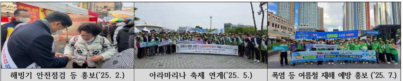
해빙기 안전점검 등 홍보('25. 2.)